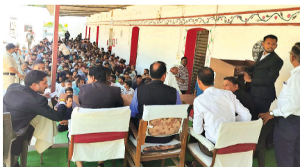
हरिभूमि न्यूज | बैतूल