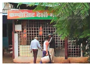
हरिभूमि न्यूज | आगला

क्षेत्र में शराब टेकेदार की मनमानी का मामला लगातार बढ़ता जा रहा है। स्थानीय नागरिकों का आरोप है कि टेकेदार की गाड़ियों से खुलेआम अवैध शराब होटलों, ढाबों और ग्रामीण इलाकों में सप्लाई की जा रही है।