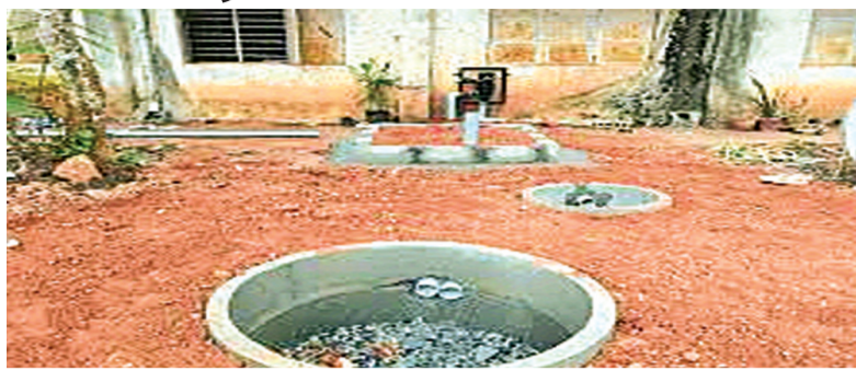
हरिभूमि न्यूज | बैतूल

शहर में बढ़ती आबादी के साथ-साथ आवासीय और व्यावसायिक निर्माण तेजी से हुआ है। इन मकानों के लिए नगरपालिका से निर्माण की अनुमति लेते समय लोगों ने वाटर हार्वेस्टिंग सिस्टम लगाने का वादा किया था और धरोहर राशि भी जमा कराई थी, लेकिन अधिकांश लोगों ने हार्वेस्टिंग सिस्टम नहीं बनाया। नतीजा पानी बचाने की दिशा में काम नहीं होने से लगातार जमीनी जलस्तर गिरता जा रहा है। बता दें कि बारिश व घरो से निकलने वाले पानी को एकत्रित करने के लिए भवन के आसपास एक गहरा गड्ढा किया जाता है। जिसमें घरो एवं भवनों की छतों से निकलने वाला बरसात का पानी तथा घरो से निकलने वाला पानी इस गड्ढे में पाइप के माध्यम से जमीन के अंदर पहुंचते हैं। इससे भूजल स्तर रिचार्ज होता है। नपा में शुल्क जमा करना होता है। यदि भवन मालिक हार्वेस्टिंग सिस्टम नहीं बनाता है तो नपा बनवाकर देती है, अन्यथा भवन मालिक द्वारा हार्वेस्टिंग सिस्टम बनाये जाने पर राशि वापस मिलती है। किन्तु अधिकांश लोग नपा में रैन वाटर हार्वेस्टिंग सिस्टम के लिए एफडी तो जमा करते हैं, लेकिन हार्वेस्टिंग सिस्टम नहीं बनवाते हैं। जिससे यह एफडी मुक्त नहीं हो पाती है। इधर नपा भी ऐसे लोगों पर टोस कार्रवाही नहीं करता है। जिससे हार्वेस्टिंग सिस्टम को केवल फाइलों में ही सीमित रह गया है।