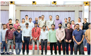
समाज को सुरक्षित बनाने में अपनी सक्रिय भूमिका निभाए।

शहर की सुरक्षा व्यवस्था को और अधिक सुदृढ़ बनाने और पुलिस-जनता के बीच समन्वय स्थापित करने के उद्देश्य से नगर रक्षा समिति के पुनर्गठन एवं एक दिवसीय कार्यशाला का सफल आयोजन किया गया। इस कार्यक्रम का मुख्य केंद्र बिंदु युवाओं को पुलिसिंग की बारीकियों से अवगत कराना और उन्हें समाज सेवा के प्रति प्रेरित करना रहा।