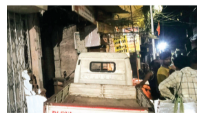
गई और मकान का चबूतरा व शटर बुरी तरह क्षतिग्रस्त हो गया। आँटो में चालक सहित तीन लोग सवार थे, जो पूरी तरह शराब के नशे में धुत थे। टक्कर इतनी जबरदस्त थी कि तेज आवाज सुनकर आसपास के लोग सहम गए।

शहर के व्यस्ततम मोरछली चौक क्षेत्र में शुक्रवार रात एक भीषण हादसा हो-होते टल गया। शराब के नशे में डूबे एक आँटो चालक ने लापरवाही से वाहन चलाते हुए सीधे एक दुकान और मकान में टक्कर मार दी। इस घटना में दुकान की दीवार और मकान का अमला हिस्सा पूरी तरह क्षतिग्रस्त हो गया, वहीं पास ही खेल रहे बच्चे और राहगीर चमत्कारिक रूप से बच गए।